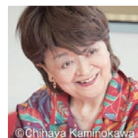
特別審査員 脚本家 内館 牧子 さん