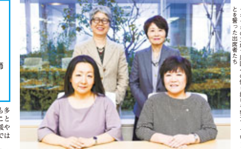
それぞれの立場で現場への働き掛けや努力していくことを誓った出席者たち

村田 中学・高校の進路指導の先生方の中にも、看護師との違いを理解しながらも、安易に准看護師養成所への進学を勧める例があります。県協会としては、進路指導教員との会議の場もあることで、職種の違いや医療現場の現状を伝えていくことが大事だと思います。