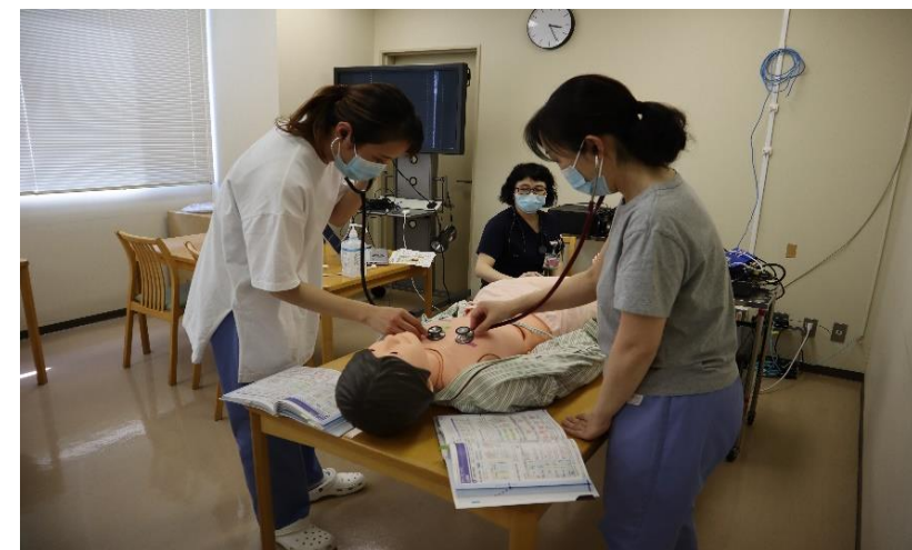
特定行為研修受講中の職員